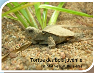
Tortue des bois juvénile © Mathieu W. Bussi res