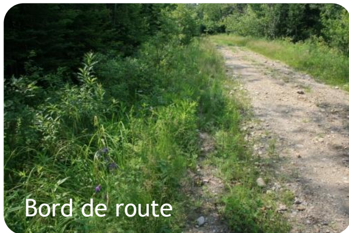
Bord de route